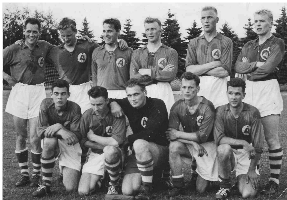
Ångermanlands landsskapslag juli 1958