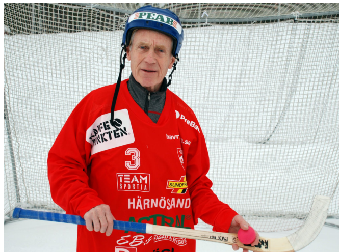
75 år men fortfarande i högsta grad aktiv efter 58 år i Härnösands AIK.

- I början spelade man bara två-tre matcher om året.