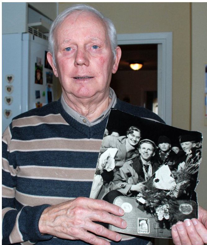
Hemma med VM-guldet. 1 500 tog emot i Timrå 1957.

Men Tre Kronor öste in mål och Eje Lindström gjorde åtta mål under turneringen. Därför räckte det till sist med oavgjort mot Ryssland i sista matchen för att Sverige skulle vinna VM. Eje Lindström gjorde två av målen och passade till ett när Sverige inför 50 000 ryssar fick 4-4 och därmed VM-guld.