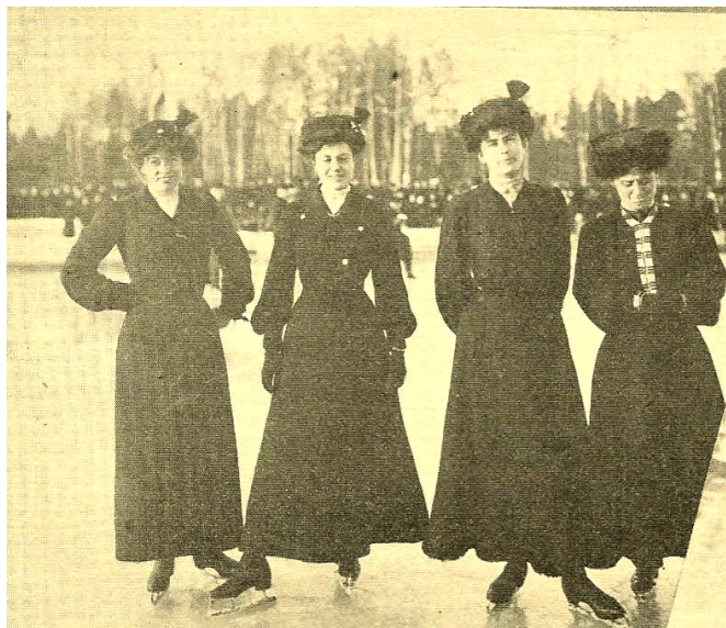
Konståkande damer 1904

Inom idrotten liksom i samhället i övrigt hade kvinnor svårt att få plats till en början. Vi har målet att i varje nummer av medlemstidningen ta upp ämnet kvinnor och idrott. Här inleder vi detta genom några axplock från och om äldre tider.