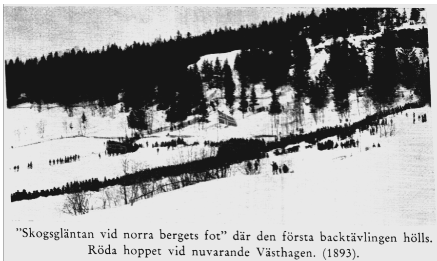
"Skogsgläntan vid norra bergets fot" där den första backtävlingen hölls. Röda hoppet vid nuvarande Västhagen. (1893).

Vädret var ingalunda gynnsamt för löpningen. Solen brände vårvarm mot den ny fallna snön, som sjönk ihop och blev så våt att man kunde krama den till bollar. Emellertid vad ville man göra leken var börjad, man måste bringa den till slut. Från musikestraden tonade en vals, prisdorna intogo sina platser och publiken stod i spänd förväntan, då en hornsignal från slutningens krön gav till känna att den förste löparen nu startade...".